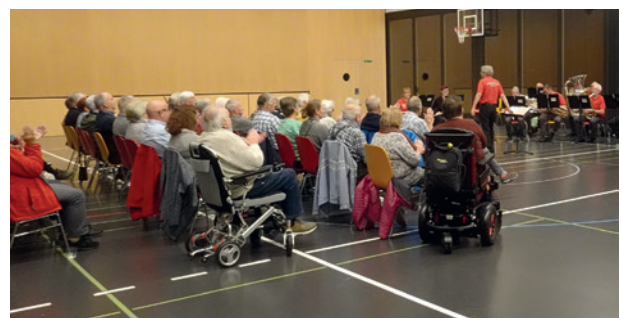
«Alle sind bereit – aufmerksame Zuhörerschaft – verdienter Applaus»