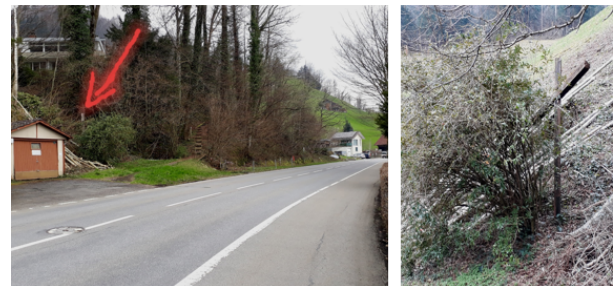
Das Seuchenkreuz im Otten