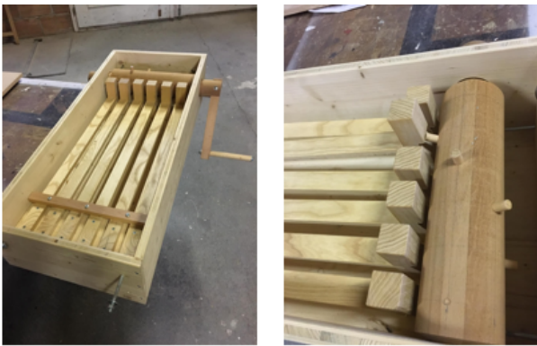
Unsere neue Rafälä

Trotz des mit dem Coronavirus einhergehenden Einschränkungen geht das Leben in der Pfarrei Lauerz weiter. Dazu finden Sie in der Folge einige Informationen.