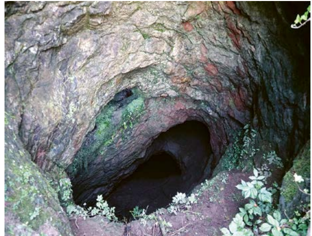
Blick vom Eingang in den Erzstollen der Chlostermatt.

18. Jahrhunderts noch nicht aufgegeben worden war. Im Jahr 1805 war den Leuten noch bekannt, dass Steinkohle vom Rossberg «schon vorzeiten» für die Eisenschmelze am Lauerzersee benutzt wurde. 8 Im Jahr 1858 wurde erneut in Erwägung gezogen, das Lauerzer Erz auszubeuten, jedoch kam es nicht mehr zur Ausführung dieses Plans. 9