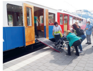
Umsteigen ins RigiBahn!

Die Reise mit dem Car führte dem Vierwaldstättersee entlang nach Vitznau. Dort hiess es umsteigen. Mit der Rigi-Bahn ging es weiter nach Rigi Kaltbad. Alle genossen die Fahrt und die wunderbare Aussicht auf See und Berge. Im Hotel Rigi Kaltbad wurde uns ein feines Mittagessen serviert. Natürlich durfte die obligate Schwarzwälder-Torte zum Dessert nicht fehlen. Für unsere Bewohnerinnen und Bewohner war der Ausflug eine willkommene Abwechslung zum Alltag.