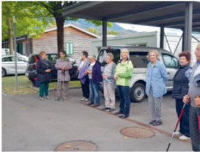
Einsatzbereit: freiwillige Betreuerinnen