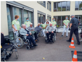
Bald geht's los...