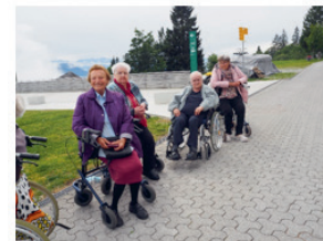
Auf der Rigi

Die Reise mit dem Car führte dem Vierwaldstättersee entlang nach Vitznau. Dort hiess es umsteigen. Mit der Rigi-Bahn ging es weiter nach Rigi Kaltbad. Alle genossen die Fahrt und die wunderbare Aussicht auf See und Berge. Im Hotel Rigi Kaltbad wurde uns ein feines Mittagessen serviert. Natürlich durfte die obligate Schwarzwälder-Torte zum Dessert nicht fehlen. Für unsere Bewohnerinnen und Bewohner war der Ausflug eine willkommene Abwechslung zum Alltag.