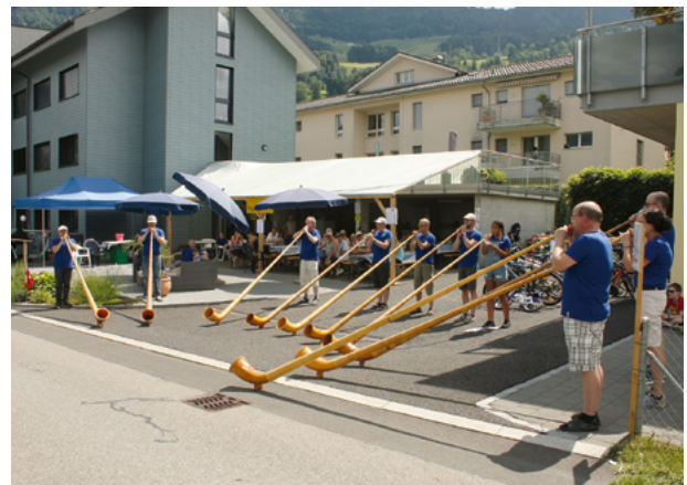
Letzte Durchführung 2018

Wir freuen uns, neben vielen Auswärtigen auch viele Lauerzer und Lauerzerinnen, ob als aktive Teilnehmer oder auch nur als Zuschauer, in unserem Beizli begrüssen zu dürfen.