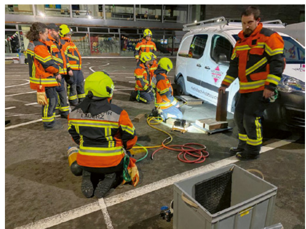
3. Übung: Umgang mit Spezialwerkzeug