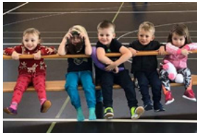
Muki / Vaki Turnen