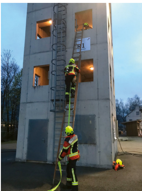
1. Übung: Leitung über die Leiter verlegen

Umgang mit Kleinlöschgeräten geübt und durch die zu berücksichtigenden theoretischen Aspekte ergänzt. Weiter wurde der Leitungsaufbau mit den dazugehörigen Mitteln und das Legen der Leitung über die Strasse und über die Leiter praktisch umgesetzt. Auch die zweite Frühlingsübung fand wenige Tage später im UFZ statt. Im Brandhaus wurde der Umgang mit den neuen Atemschutzgeräten eingeübt. Während gleichzeitig dazu eine Flächenbrandbekämpfung durchgeführt wurde. Die dritte und somit letzte Frühlingsübung in diesem Jahr fand in Lauerz statt. Mithilfe von vier Posten wurden unterschiedliche Schwerpunkte gesetzt. Neben dem Umgang mit dem Spezialwerkzeug der Feuerwehr Lauerz wurde die Mannschaft in den neu erlernten Waldbekämpfungstaktiken durch das Kader geschult. Beim dritten Posten ging es um die Objektzugänglichkeit, also wie man sich am schnellsten, effizientesten und sichersten den Zugang zu unterschiedlichen Räumlichkeiten verschafft. Abgerundet wurde diese Übung durch den vierten Posten, bei welchem die Herzdruck-Massage und der Umgang mit dem Defibrillator (AED) geschult wurden. Wichtig zu erwähnen ist hierbei, dass die Gemeinde Lauerz erfreulicherweise