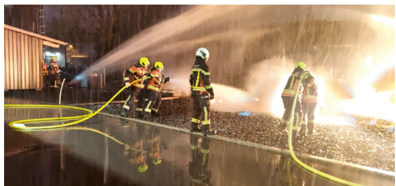
2. Übung: Flächenbrandbekämpfung verlegen