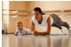
Bikini Fit / Ski Fit