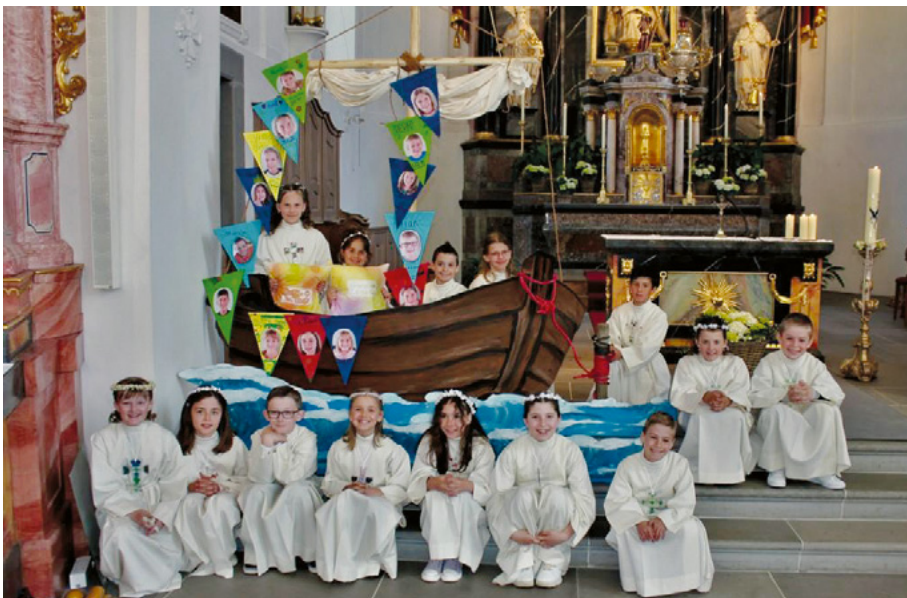
Die fröhliche Schar unserer Erstkommunikanten.

Wir bedanken uns für die Durchführung des OeRel-Tages und danken auch der Küchenmannschaft für das feine Essen.