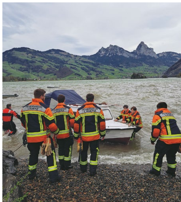
Erster Einsatz für zwei unserer neuen Aktivmitglieder

Die Feuerwehr Lauerz darf sich zudem über drei Neueintritte freuen, welche motiviert, kompetent und voller Tatendrang mit dem Rest der Mannschaft die Frühlingsübungen absolviert haben. Zwei der Neueingetretenen haben ihren ersten Einsatz bereits erfolgreich gemeistert. Während den heftigen Föhnstürmen wurde die Feuerwehr Lauerz gerufen, um ein Boot vor dem Sturm zu retten.