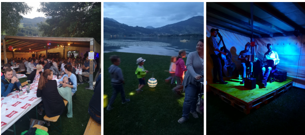
1. Augustfeier 2019

Die von der Guggenmusik Gätterlifurzer organisierte 1. Augustfeier 2019 war ein voller Erfolg. Rund 150 Besucherinnen und Besucher genossen bei besten Wetterbedingungen die Feier am Vorabend des Geburtstages der Schweiz auf der Badi Wiese.