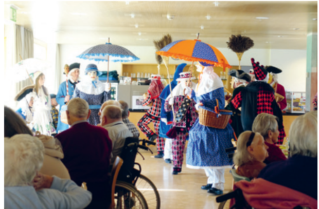
Die Bewohnerinnen und Bewohner freuten sich über den Besuch der Rott.