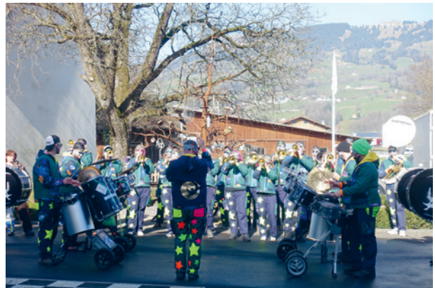
Die Bogäspeuzer in Aktion.

wohner das Geschehen auf dem Vorplatz und freuten sich über die wunderbaren fasnächtlichen Klänge.