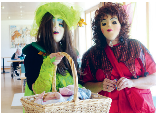
Maschgradenbesuch: Fröilein Schönhaar und Fröilein Chrüselihaar verteilten Krapfen.