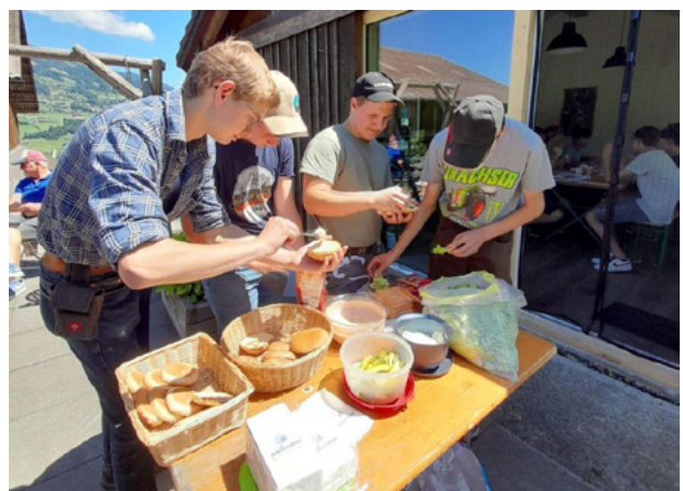
Besuch im Bauernhof obere Huelen