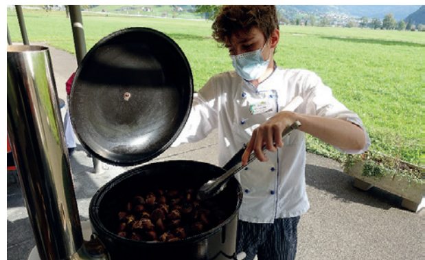
Mhmmm – heissi Marroni