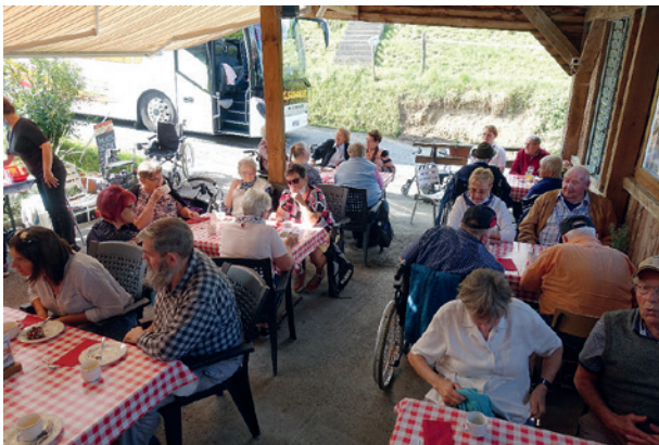
Gemütliches Beisammensein bei Kaffee und Kuchen.

Ein grosses Dankeschön geht an alle Begleiterinnen, insbesondere an die freiwilligen Betreuerinnen. Wir sind immer wieder froh und dankbar für ihre Unterstützung.