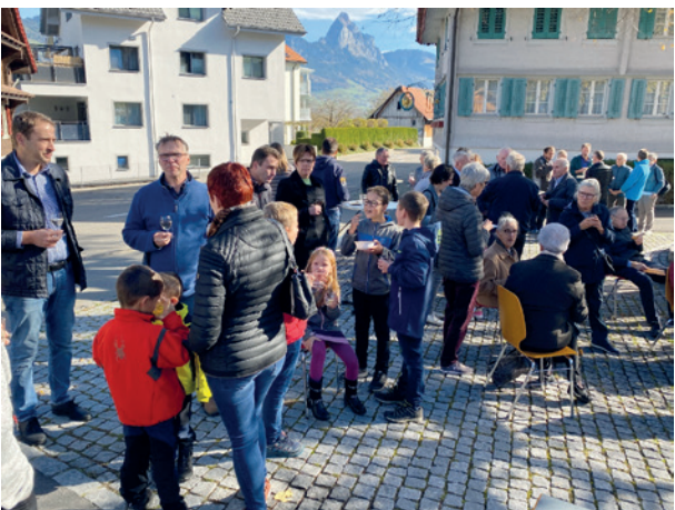
Ein Teil der Besucher geniessen Apéro und den tollen Ausblick auf die Mythen vom Dorfplatz aus.

Vielen Dank an alle, die der Einladung des Gemeinderats Folge geleistet haben und so zu diesem gelungenen Anlass beigetragen haben.