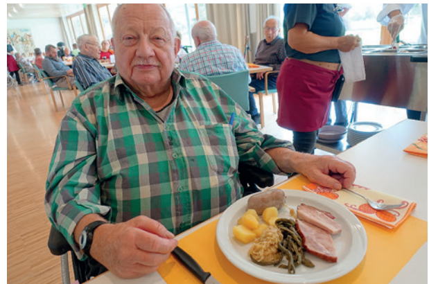
Das «Metzgete-Zmittag» war ein Genuss!

Herzlichen Dank allen, die zum Gelingen des gemütlichen Anlasses beigetragen haben.