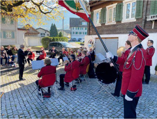
Rassige Klänge der Musikgesellschaft Steinerberg bereichern den Apéro