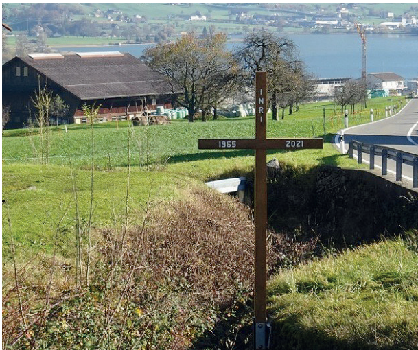
Das neue Kreuz am Teubertsbach