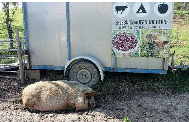
Ihr ist's sauwohl.